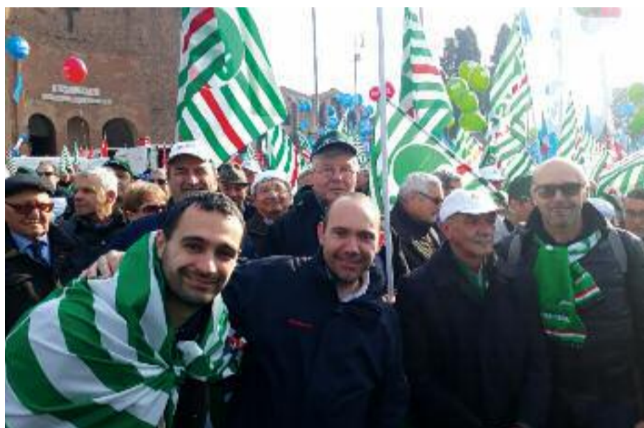
Roma. Piazza della Repubblica. Giovani e meno giovani insieme dalla Granda alla Capitale.