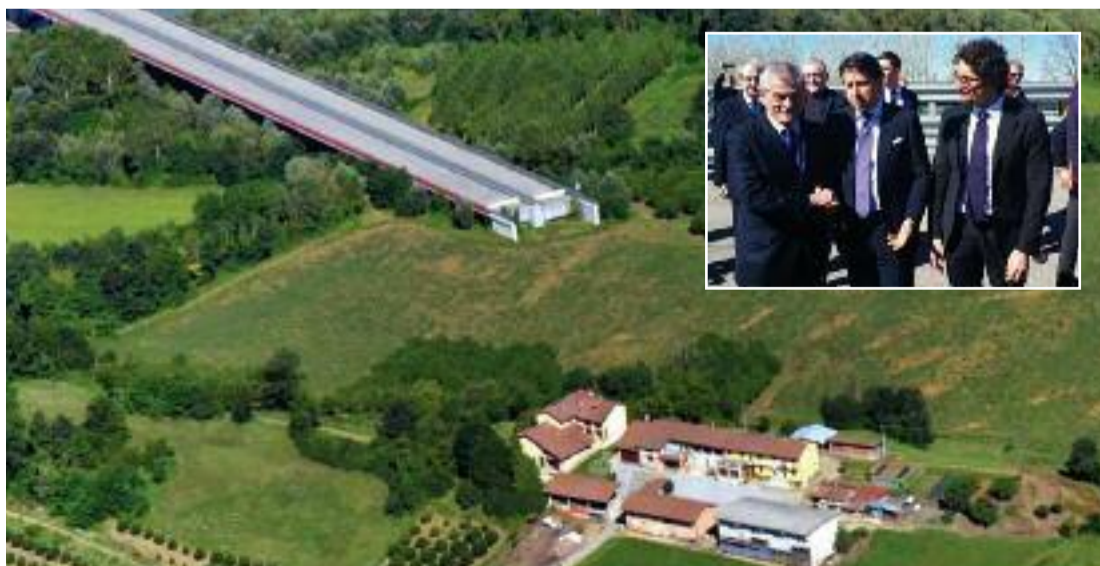
La grande incompiuta del Nord-Ovest. Così è stata ribattezzata la Cuneo-Asti qui sopra mostrata in un'immagine emblematica. Il suo completamento è atteso da 27 anni! Nel riquadro in alto un momento della visita del premier Conte e del ministro Toninelli, insieme al presidente della Regione Chiamparino sul cantiere della Cuneo-Asti.

che si parla di nuovo ospedale. E' un altro di quei cantieri infiniti. Resta connesso al tema dell'ospedale la questione strada". Aprire l'ospedale e non avere una via di accesso efficace sarebbe l'ennesimo paradosso di una provincia che attende dall'edilizia un sostegno adeguato per potersi affrancare da una crisi che le previsioni future mostrano nuovamente profilarsi all'orizzonte.