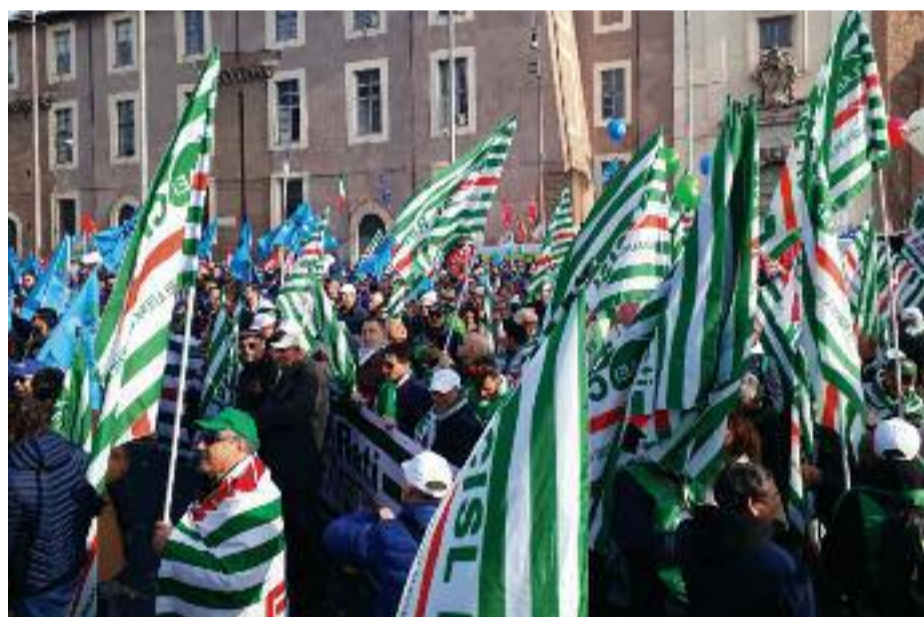
I colori Cisl spiccavano nel lungo corteo tra piazza della Repubblica e piazza San Giovanni.